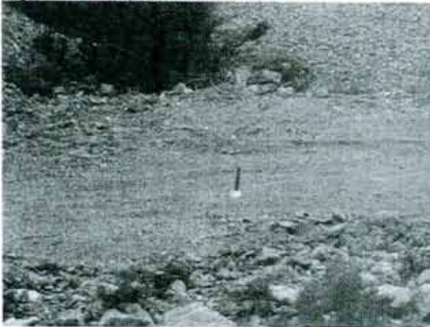
Figura 7: Prospección Minera

Norte: 6413178 m y Este: 366267 m, PSAD 1956