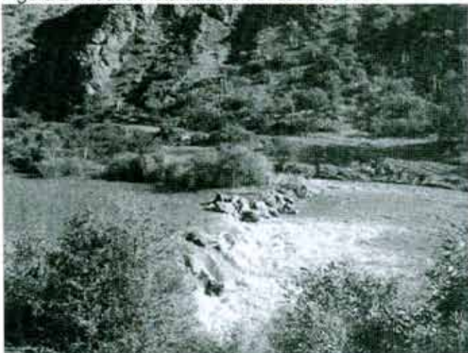
Figura 2. Rocas instaladas en el cauce del río